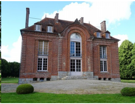
La façade sud