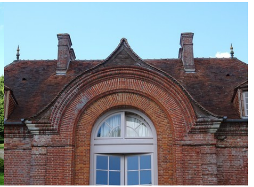
Un détail de l'arcade centrale en briques