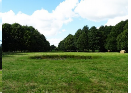
La perspective vers le Nord

Pour la zone en rose foncé dans le périmètre de 500m