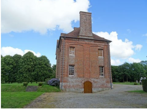
La façade ouest