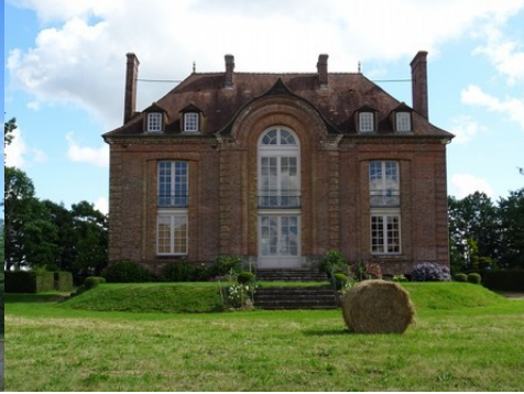
La façade nord