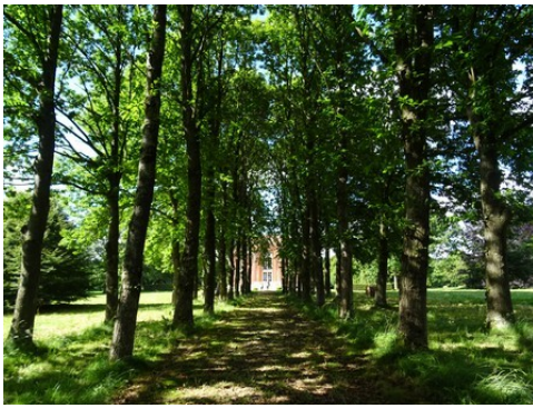
L'allée plantée au Sud du château