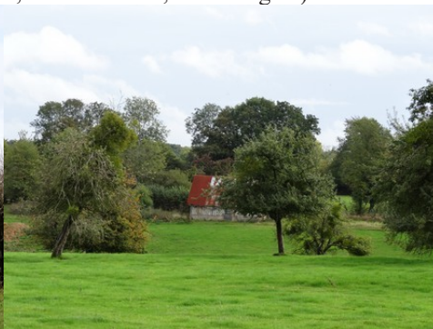
La campagne voisine