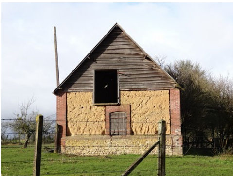
Un exemple d'architecture rurale

Les avis seront cohérents avec ceux émis ces derniers années, à savoir : pas de maisons à volume compliqué (type V, W, Y, ou Z), pentes à 45° pour les volumes principaux, ardoise ou tuile plate de teinte brun vieilli, à 20u/m 2 , avec un débord de toiture de 20cm, enduit de teinte beige clair avec modénatures (au choix : chaînages, encadrement de fenêtres, soubassement, colombage...). *Voir les autres fiches.